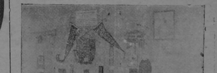
Algunos de los trabajos presentados por el Liceo de Costa Rica a la Exposición Nacional, y que merecieron medalla de oro.